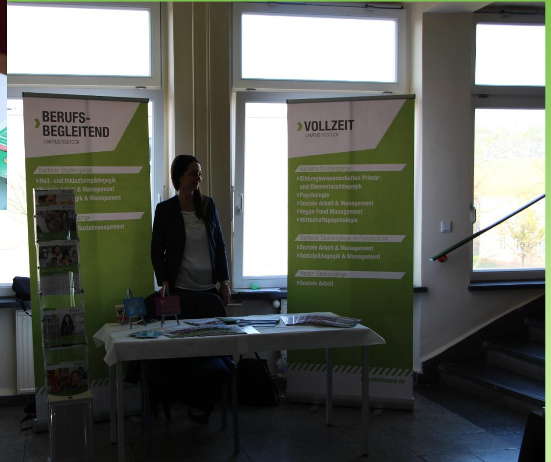
Fachhochschule des Mittelstandes Rostock (FHM)