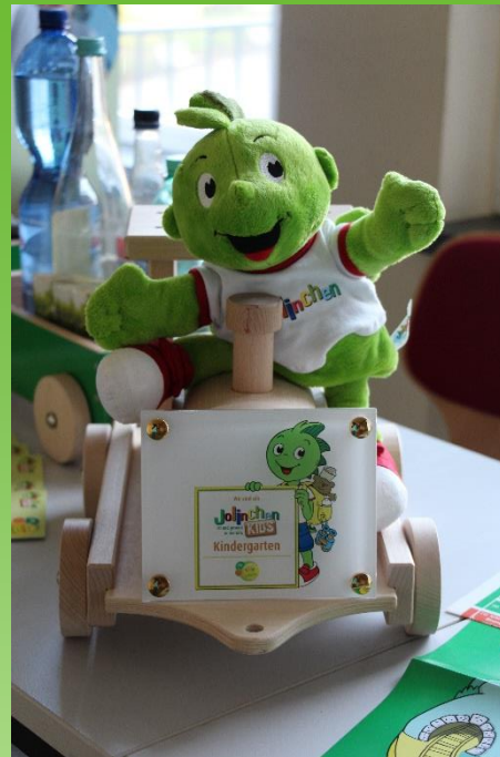
AOK Nordost mit ihrem Programm Jolinchen Kids (oben im Bild)