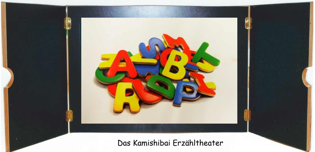
Das Kamishibai Erzähltheater